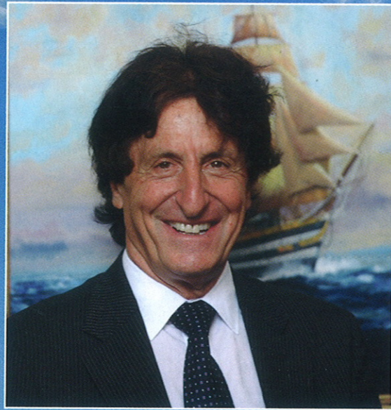
Il Presidente della Camera di Commercio di Latina Vincenzo Zottola. Un momento del 2° Forum Nazionale sull'Economia del Mare, uno dei convegni più importanti di questa edizione, organizzato insieme alla rivista "Economia del Mare". In basso, una delle imbarcazioni del campionato nazionale di Dragon Boat.